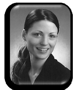
Sina Ruf Betreuung E-Learning